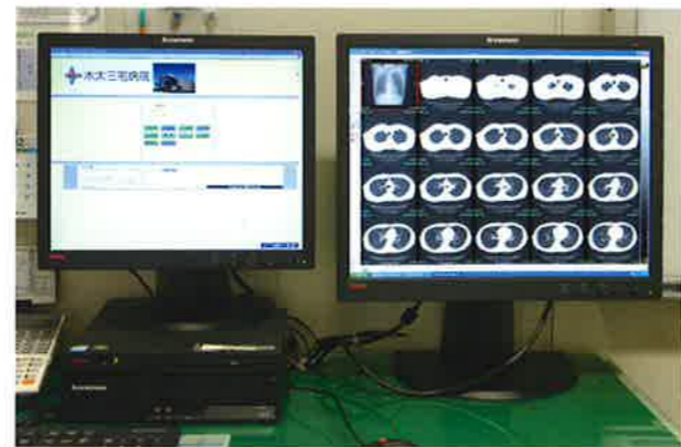
電子カルテシステム